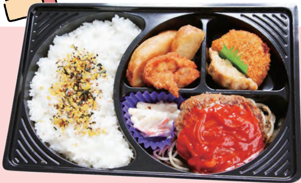
C. スマイルランチ 1,026円 (税込)

オムライス、エビフライ、唐揚げ、ウインナー、ナポリタン、マカロニサラダ、デザート、他 (外寸 275mm×182mm)