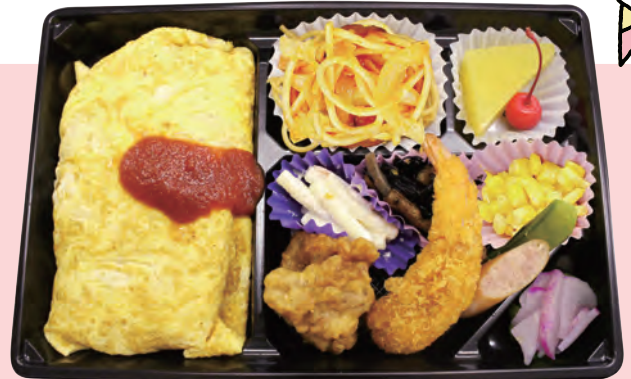
B. オムライス弁当 1,080円 (税込)

かしわ飯、白飯、エビフライ、唐揚げ、玉子焼、ウインナー、コーン、ナポリタン、マカロニサラダ、デザート、他 (外寸 275mm×182mm)