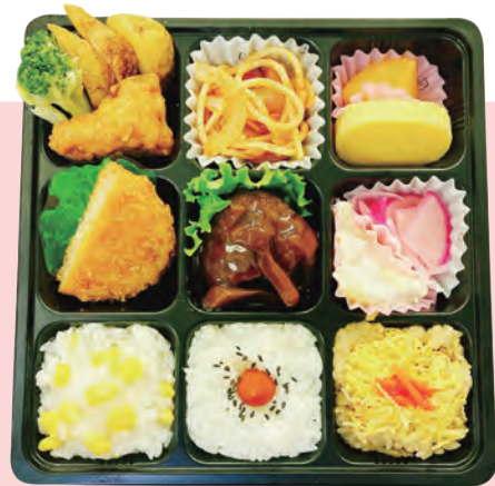
D. 洋風お楽しみ箱 918円 (税込)

ハンバーグケチャップソース、唐揚げ、フライドポテト、コロケ、マカロニサラダ、他 (外寸 275mm×182mm)