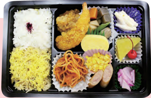
A. 2色ごはんエビフライ弁当 1,080円 (税込)

かしわ飯、白飯、エビフライ、唐揚げ、玉子焼、ウインナー、コーン、ナポリタン、マカロニサラダ、デザート、他 (外寸 275mm×182mm)